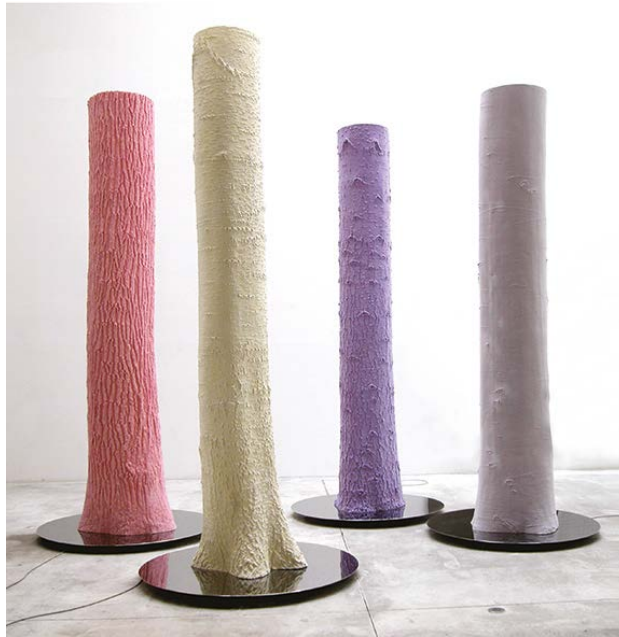
Didier MARCEL - Sans titre - 2002 Résine, acrylique, acier 4 x (300 x 120 cm) Collection FRAC Auvergne