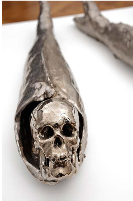
Johan Creten - Nur ein Fisch - 1992 Platine et émail sur terre cuite 100×24 ×20 cm Collection FRAC Auvergne