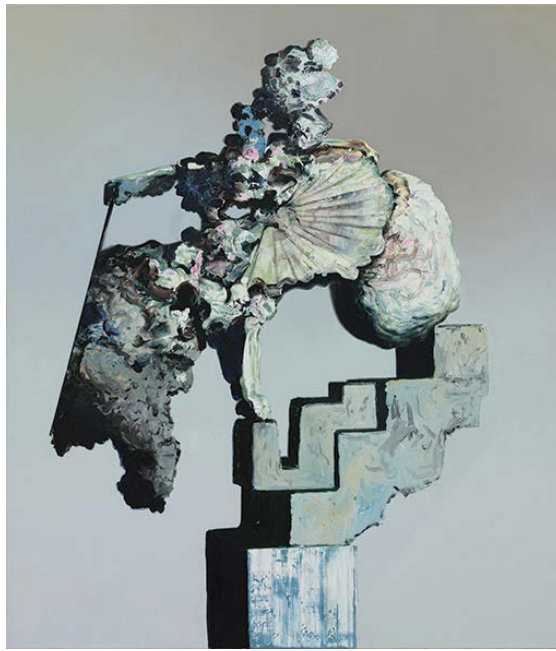
Ivan Seal - epitranxisticemestionscers desending - 2017 Huile sur toile - 150×130 cm Collection FRAC Auvergne