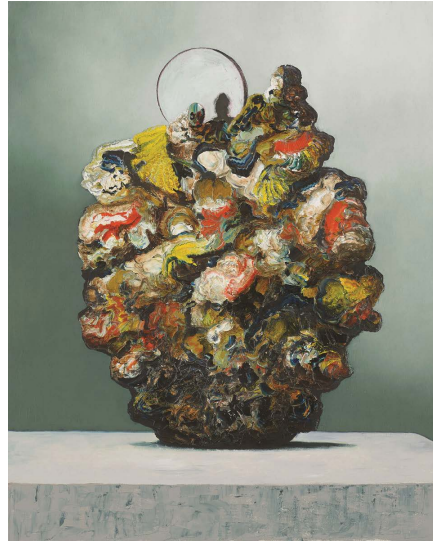
Ivan Seal - nowoincas guiderekoi idiometriv 2018 - Huile sur toile - 80 x 64 cm