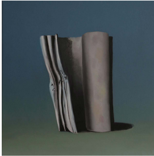
Ivan Seal - beaten frowns after - 2016 Couverture du premier opus de Everywhere At The End Of Time de The Caretaker