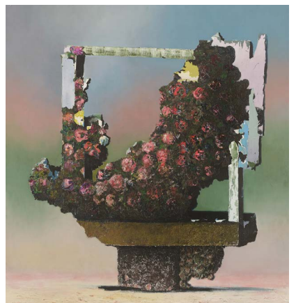
Ivan Seal - quebecrebu prisoidialogfrephe - 2018 Huile sur toile - 150 x 140 cm