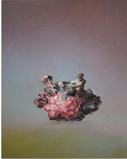
Ivan Seal - custmcoomo aboridouchepehste - 2018 Huile sur toile - 50 x 40 cm