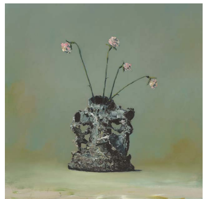
Ivan Seal - pittor pickgown in khatheinstersper - 2015 Huile sur toile - 130 x 100 cm