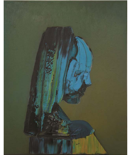
Ivan Seal - giltsholder - 2017 Huile sur toile - 50 x 40 cm