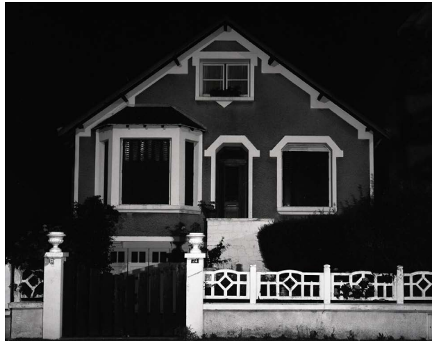
Xavier Zimmermann - Façade 14 1994 - Photographie - 120 x 150 cm Collection FRAC Auvergne Donation Robelin