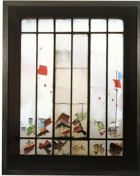
Stéphane Couturier - Usine Gévelot à Issy-les-Moulineaux - 1995 Cibachrome sur diasec - 155 x 125 cm Collection FRAC Auvergne