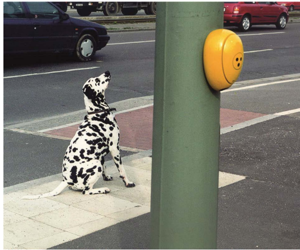
Stephen Wilks - Sans titre ( Friedrichhein, Berlin ) 2000 - Photographie - 100x140 cm Collection FRAC Auvergne Donation Robelin