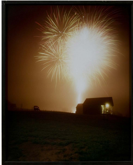
Bruno Serralongue - Feu d'artifice 14/7/00 2000 - Photographie - 51,5 x 41,5 cm Collection FRAC Auvergne - Donation Robelin