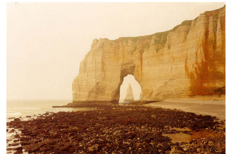
Elger Esser - La Manneporte - 2001 Tirage chromogène - 130 x 185 cm