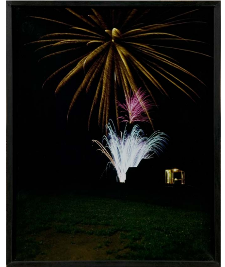
Bruno Serralongue - Feu d'artifice 14/7/00 2000 - Photographie - 51,5 x 41,5 cm Collection FRAC Auvergne - Donation Robelin

Jean-Charles Vergne Directeur du FRAC Auvergne