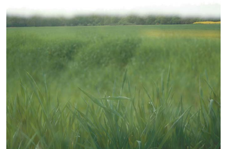
Xavier Zimmermann - Paysage ordinaire n°14 2005 - Tirage argentique sur papier baryté 180 x 210 cm - Collection FRAC Auvergne