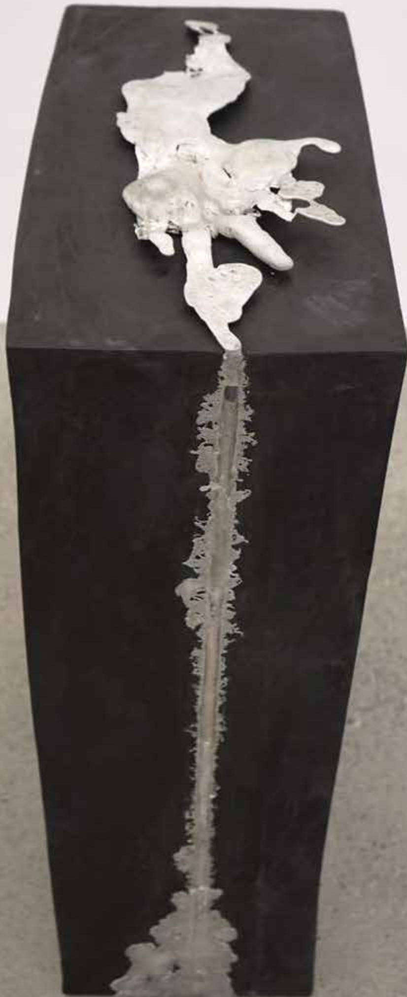
Longterm Translation - 2017 - Caoutchouc, étain - 56 x 28 x 88 cm