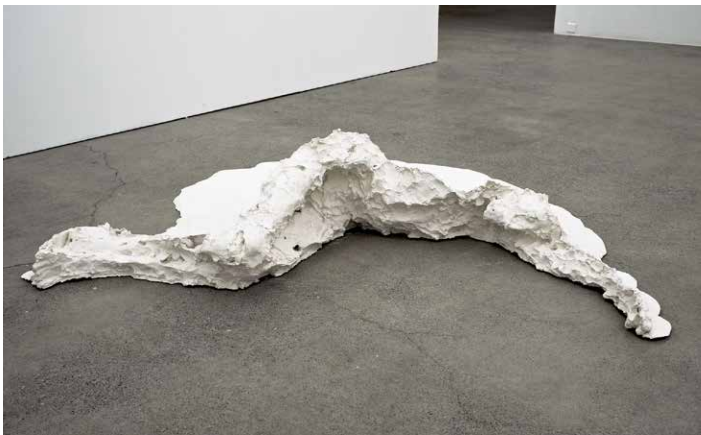
Liegende - 2013 - Acrystal - 174 x 135 x 38 cm - Collection FRAC Auvergne