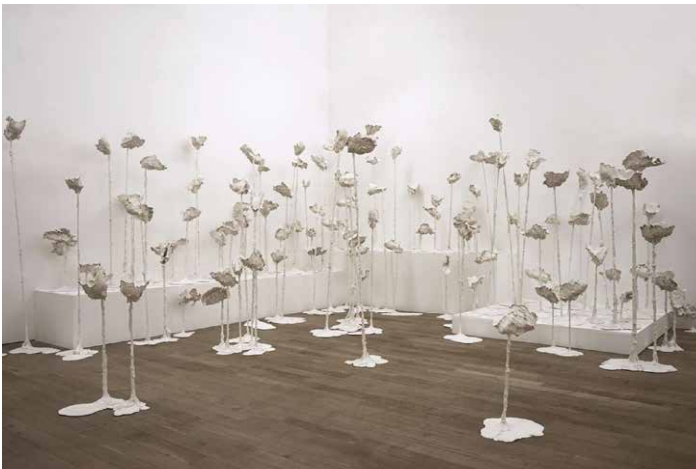
Dictation - 2015 - Acryl, acier - Dimensions variables