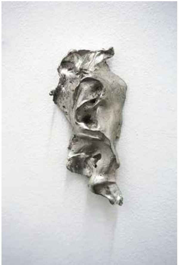
I Talk to You Later - 2016-2017 - Étain - Dimensions variables