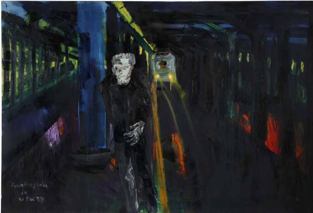
Rainer Fetting - Frankenstein's Monster in Subway - 1985 - Huile sur toile 214 x 313 cm - Collection FRAC Auvergne

Découvre l'œuvre de Rainer Fetting. C'est un peintre allemand qui s'est inspiré d'une histoire célèbre.