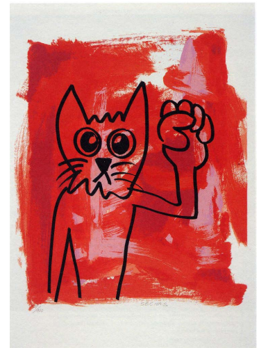
Alain Séchas - Sans titre - 1996 Sérigraphie - Dépôt du Cnap