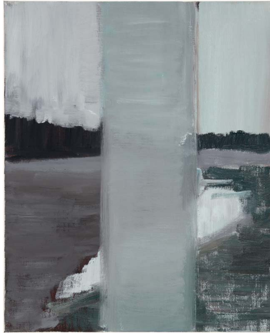
Ilse D'Hollander - Sans titre O/C:238/H06 1996 - Huile sur toile - 38 x 31 cm Collection FRAC Auvergne