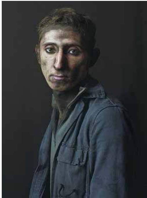
Pierre Gonnord - Armando - 2009 Impression quadri sur vinyle 165 x 125 cm Production FRAC Auvergne