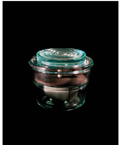
Raphaël Dallaporta - GMMI 43 'Glass Mine' Germany - 2004 - Cibachrome 29 x 22,7 cm - Dépôt du Cnap au FRAC Auvergne