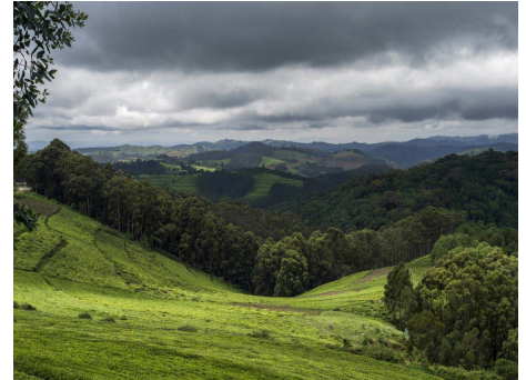
Alexis Cordesse - Sans titre, forêt primaire de Nyungwe. Série Absences, Rwanda #1 2013 - C-print contrecollé sur aluminium 120 x 160 cm - Dépôt du Cnap au FRAC Auvergne