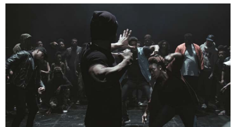
Clément Cogitore - Les Indes Galantes 2017 - Vidéo - 6 min Collection FRAC Auvergne