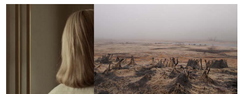
Anne-Sophie Émard - Kate - 2013 Caisson lumineux - 54 x 129.5 x 7.5 cm Collection FRAC Auvergne