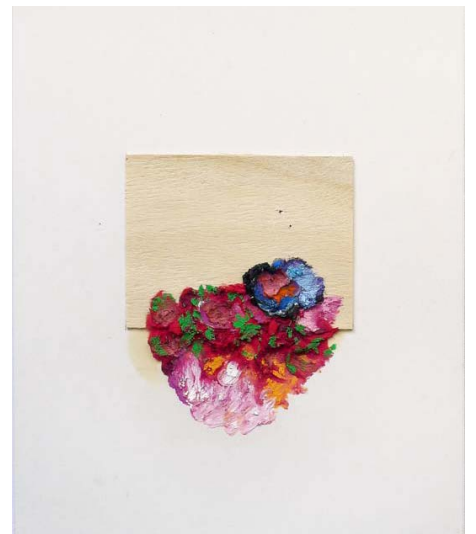
Éric Provenchère - A Woman's Day - 2012 Technique mixte - 20 x 30 cm Collection FRAC Auvergne