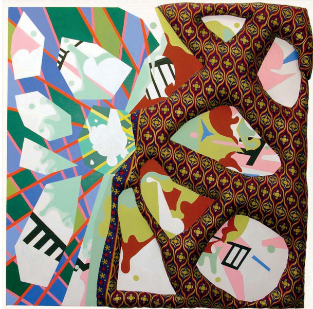
Dominique Liquois - Bad Stream - 2009 Huile, acrylique sur toile, tissu, rembourrage, fil - 152 x 150 cm Collection FRAC Auvergne