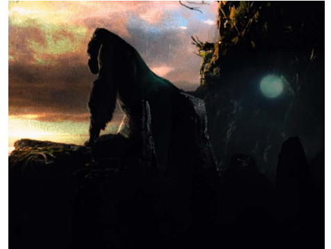
Camille Henrot - The Moon Ape - 2007 Épreuves contrecollées sur aluminium 24.5 x 29.5 cm - Dépôt du Cnap au FRAC Auvergne

Ainsi, par coïncidence ou au contraire avec acuité, les œuvres de cette exposition nous révèlent leurs possibles combinaisons.