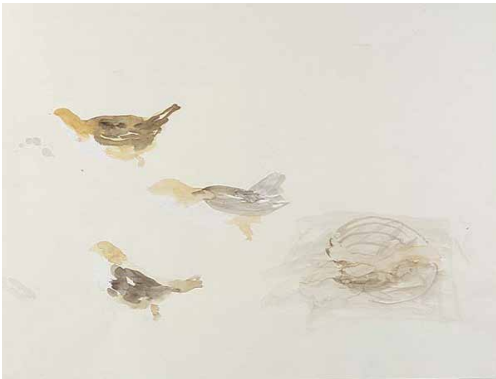
– Sans titre - 1996 - Aquarelle sur papier - 50 x 65 cm - Collection FRAC Auvergne